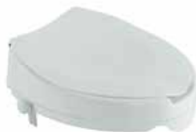
CA6741 - 4

De acero inoxidable. Se separa en piezas para facilitar su almacenamiento. Lleva reposabrazos integrados y una palanca con 4 posiciones permitiendo bloquear el giro del asiento para una mayor seguridad.